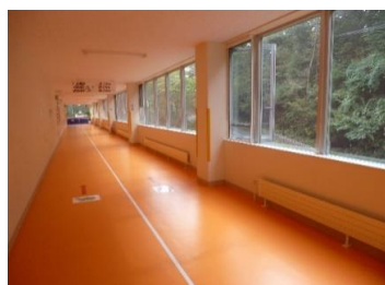
ランニングコース